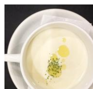
▲ <洋食亭ブルームス> 「じゃがいもの冷製スープ」 (500円)