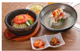
▲ <韓国酒家 韓国家庭料理 吾照里> 「選べてお得な韓流セット」 (ランチ 1,490円/ ディナー 1,590円)