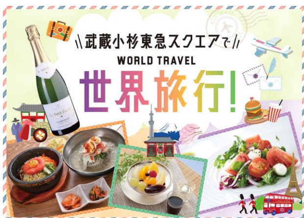
▲ 「武蔵小杉東急スクエアで世界旅行！」 キービジュアル