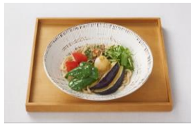
▲ <うどん そば 釜飯 かかや> 「京野菜と山形だしのぶっかけうどん（冷）」 (1,200円) ※7月2日より限定販売