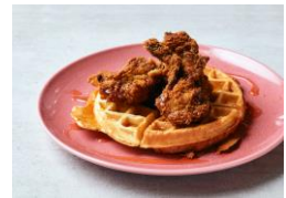
▲ <ワイアード カフェ> 「ワッフルチキン」 (1,320円)