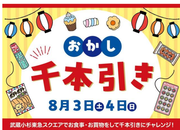
▲ 「おかし千本引き」キービジュアル

当施設は、開業11周年を迎えた2024年3月から4月にかけて開催したアニバーサリーイベントにて、当施設で夏休みに実施してほしいイベントを募集しました。集まった案の中から、「世界旅行」と「祭り」を取り上げ、歴史的な円安により海外旅行に行くことがためられる状況下でも、気軽に世界旅行気分を味わうことができるグルメイベント「武蔵小杉東急スクエアで世界旅行！」と、涼しい屋内でお祭り気分を感じられる「おかし千本引き」を開催します。