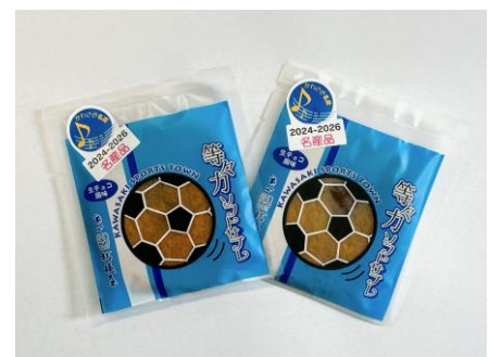
▲ <菓心 桔梗屋> 「等々カソフトサブレ」

参加条件：イベント参加当日のお買い上げ1,000円以上（合算不可）のレシート提示