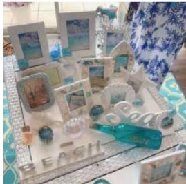
海雑貨&BAR Aperitivo ハワイアン雑貨など 海に関する雑貨や食器類、 リゾートに似合うオリジナル ワンピースなどを販売。