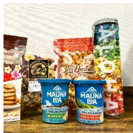
ハワイアンセレクトショップ ダブルレインボー ポップコーン専門店 ハワイで人気のフードを 集めて皆さまにお届けします。