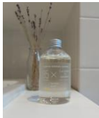
※賞品イメージ抜粋