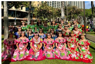
▲フラハーラウオマカナニ