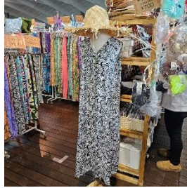
Moanamama リゾートアパレルなど 日常でもアロハな気分であられる オリジナルリゾートウェア、 雑貨に出会えます。