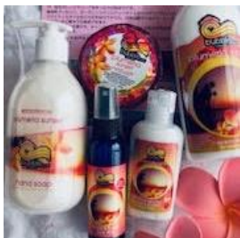
Waipio8011 ボディケア用品など ハワイ直輸入のオーガニック ボディローションなどを販売。