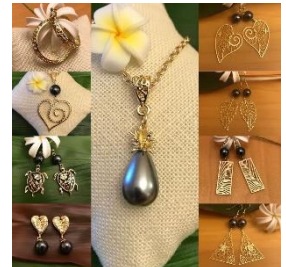
Milimili ハワイアンアクセサリー ハワイをイメージした オリジナルのハンドメイド アクセサリーを販売。