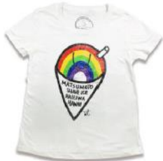
Surf' N Sea Matsumoto Shave Ice Tシャツなどのアパレル ノースショア、ハレイワにある 老舗の2店舗が共同出店！