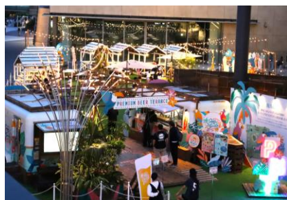
▲プレミアムビアテラス イメージ