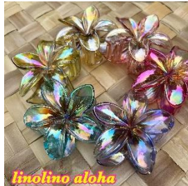
linolino aloha ハワイアン雑貨 ハワイアンクラフト商材や 懐かしくホットできるハワイアン 雑貨を豊富に揃えています。