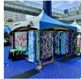
TO SEA リゾートアパレルなど 海からインスピレーションされた アートパレオやアパレルなどを 取り揃えています。