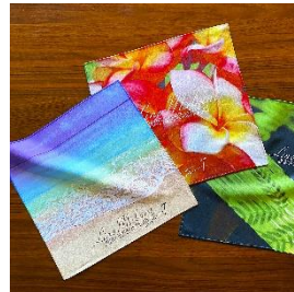
LINO MAKANI HAWAII ハワイアン雑貨 写真家 高山 求が撮影した、 ハワイの島々の写真をプリントした オリジナルグッズなどを販売。