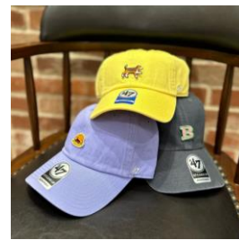
フォーティーセブン オリジナルキャップ ハワイモチーフの ワッペンを選んで作る オリジナルキャップを販売。