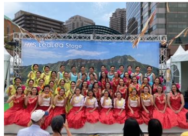
▲カフラオラウレア