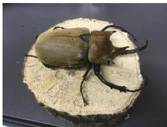
エレファントゾウカブト