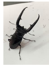
マンディブリスフタマタクワガタ