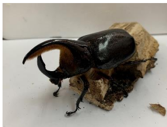
サタンオオカブト

内容：ふれあい体験、誌面タペストリー展示、生体展示、標本展示、記念撮影、特別販売、 来場したお子さま限定でぬり絵付き昆虫クイズシートをプレゼント（未就学児は対象外）