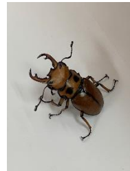
メリーメンガタクワガタ