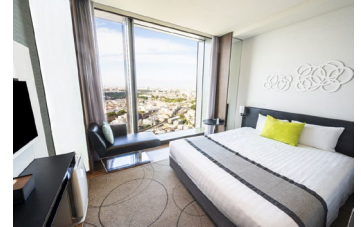
スーペリアダブル