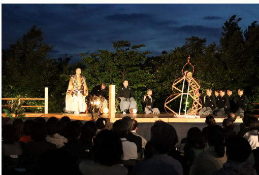
「二子玉川ライズ薪能」の様子（2024年撮影）