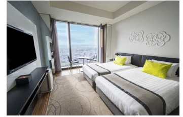
スーペリアツイン